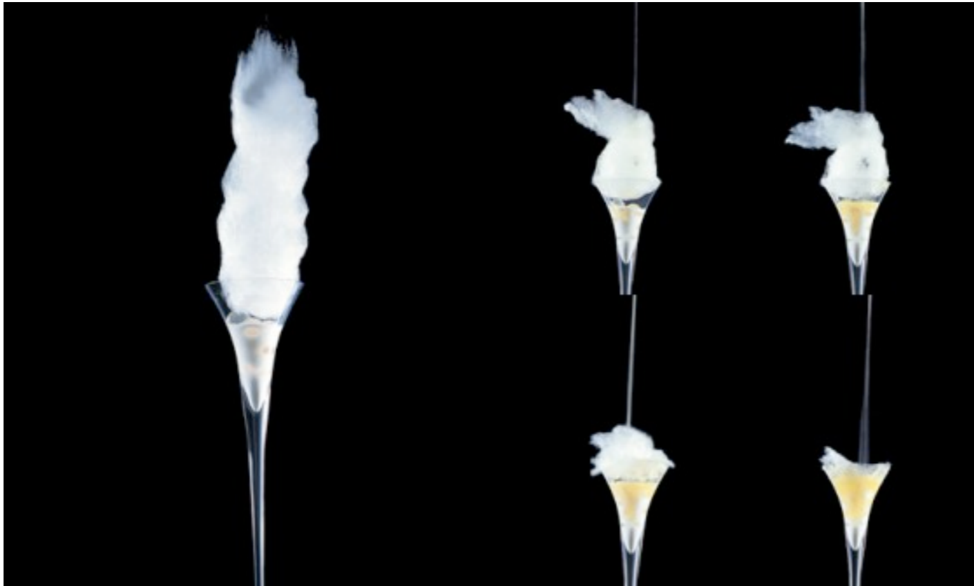
Piña colada, barbapapá que se va / Piña colada, disappearing candy floss (2004)