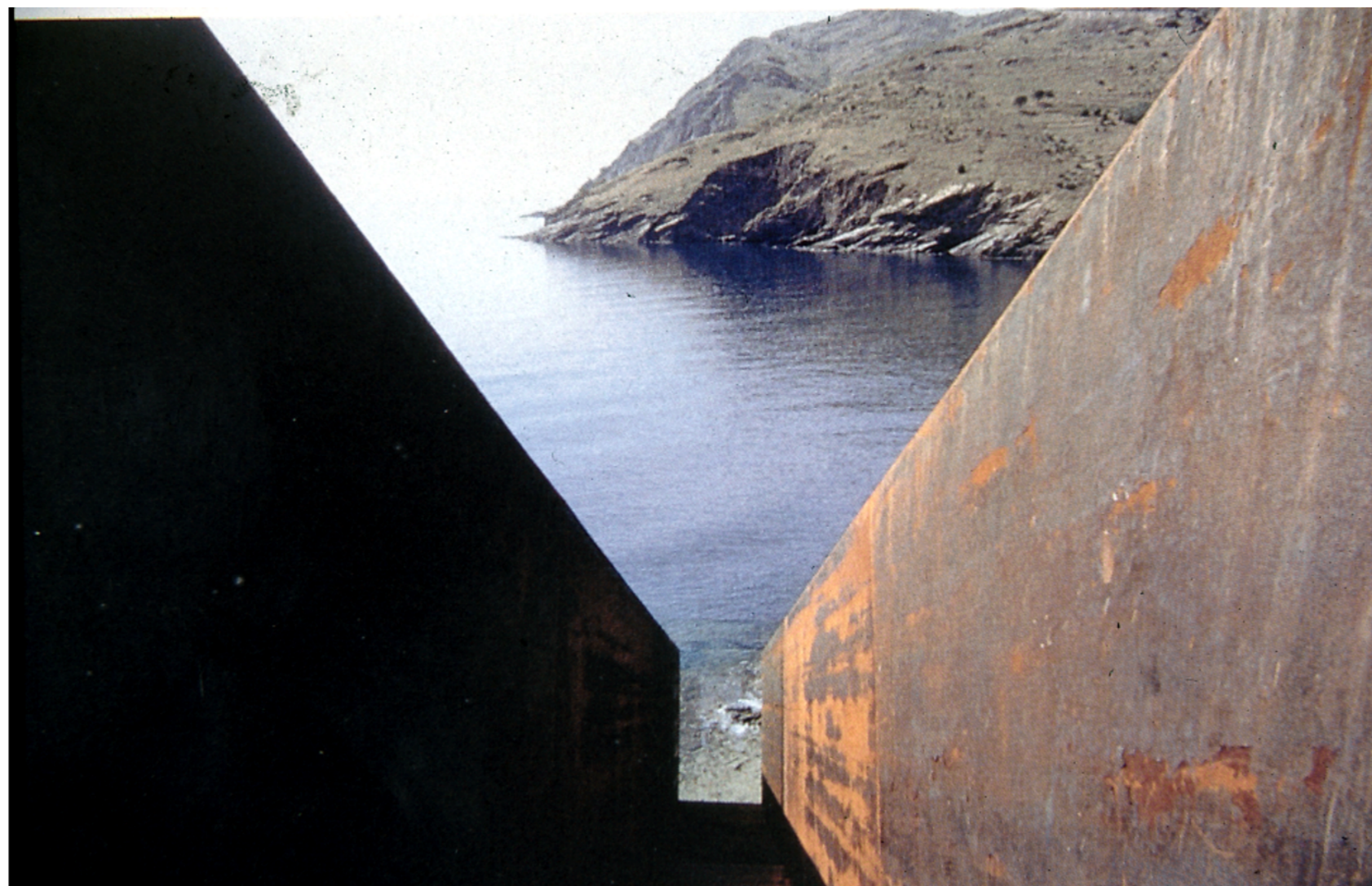
Dani Karavan, Passatges-homenatge a Walter Benjamin , Portbou, 1990-94