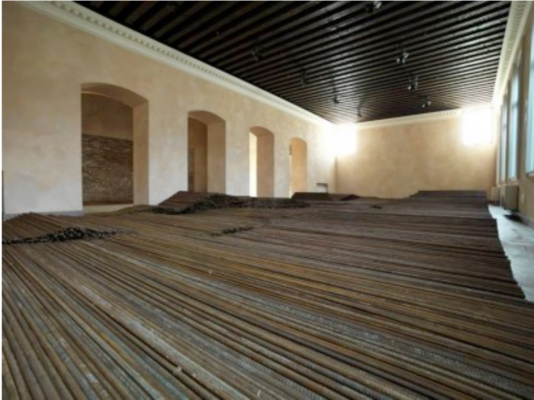
Zuecca Project Space, Giudecca, 2013