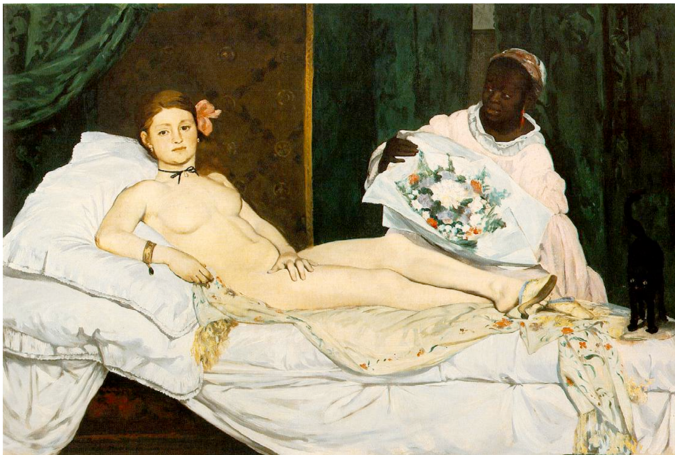
Édouard Manet, Olympia , 1865