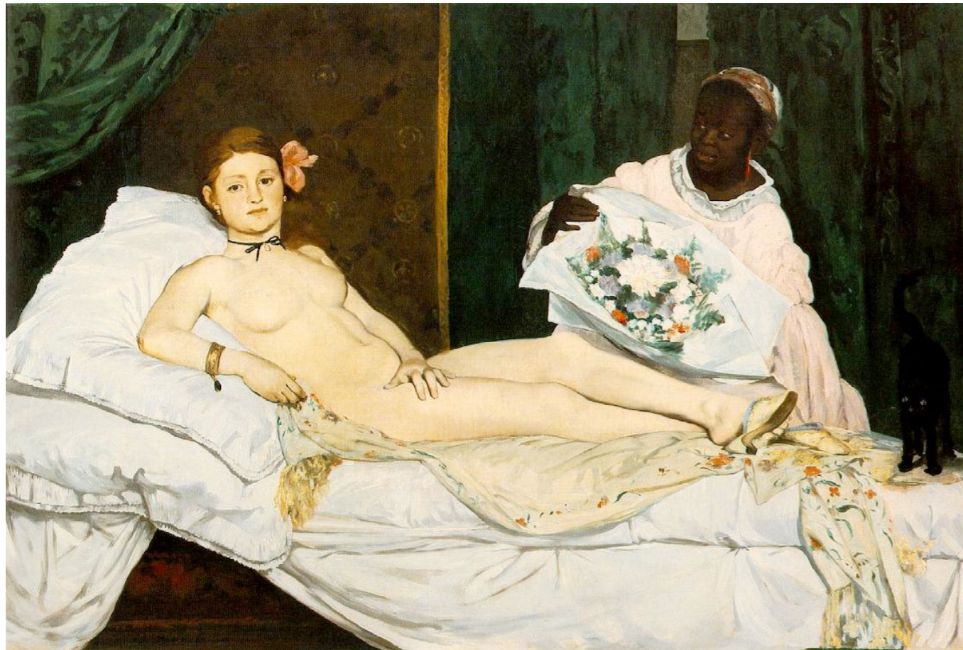
Manet, Olympia , 1865