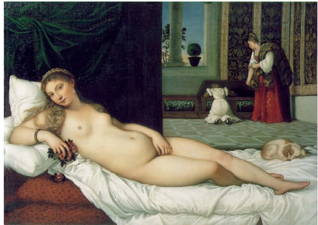
Tiziano, Venus de Urbino , 1538