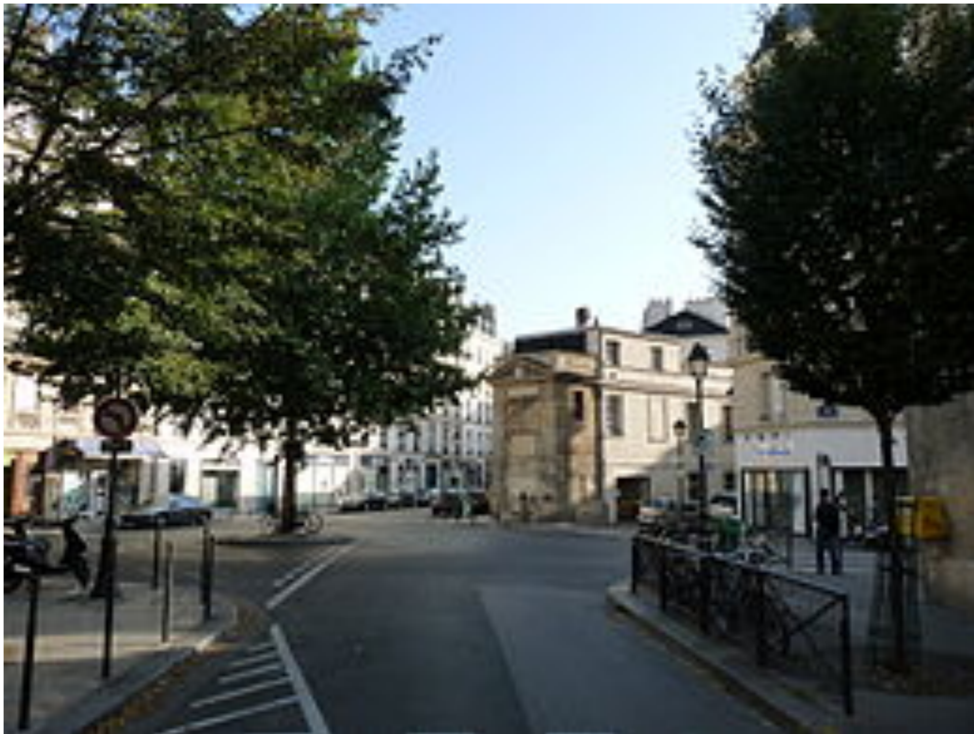
Place Olympe de Gouges, Illé